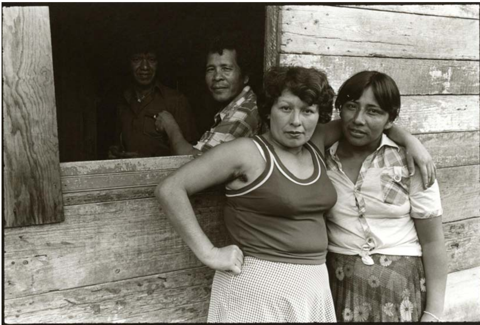
Mitchell Denburg, Prostitutas y dos de sus amigos , Ciudad de Guatemala 1980. Plata sobre gelatina 28x36 cm