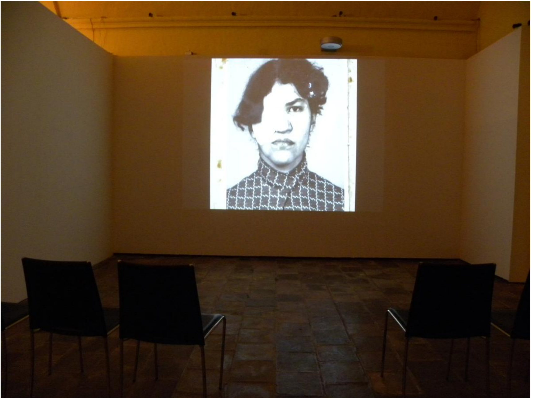
Proyección del video Mateo, Marcos, Lucas y Juan 2012-2013 4.08m