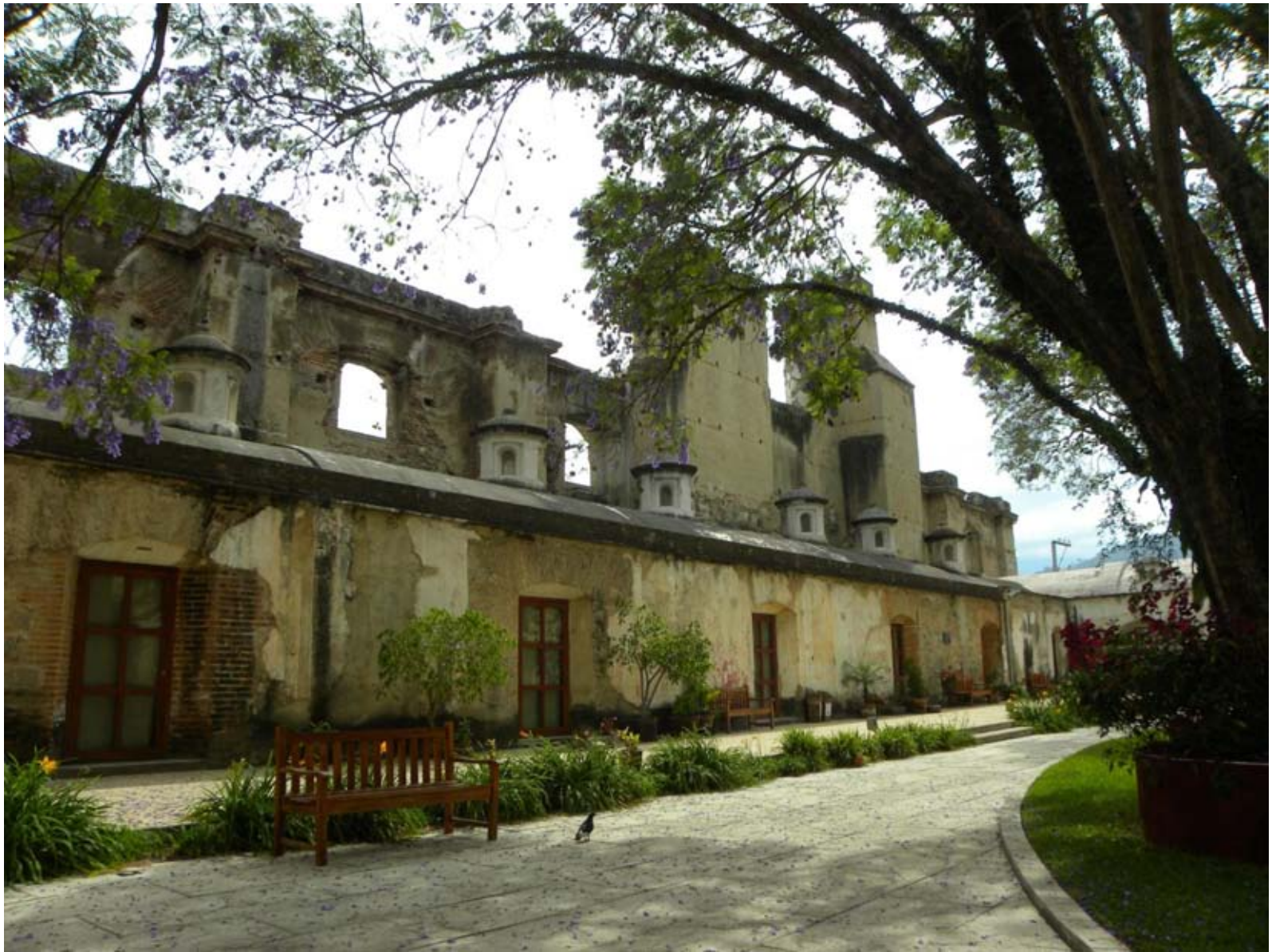
Desde el Patio de la Huerta, vista del cañón donde se exhibe la muestra