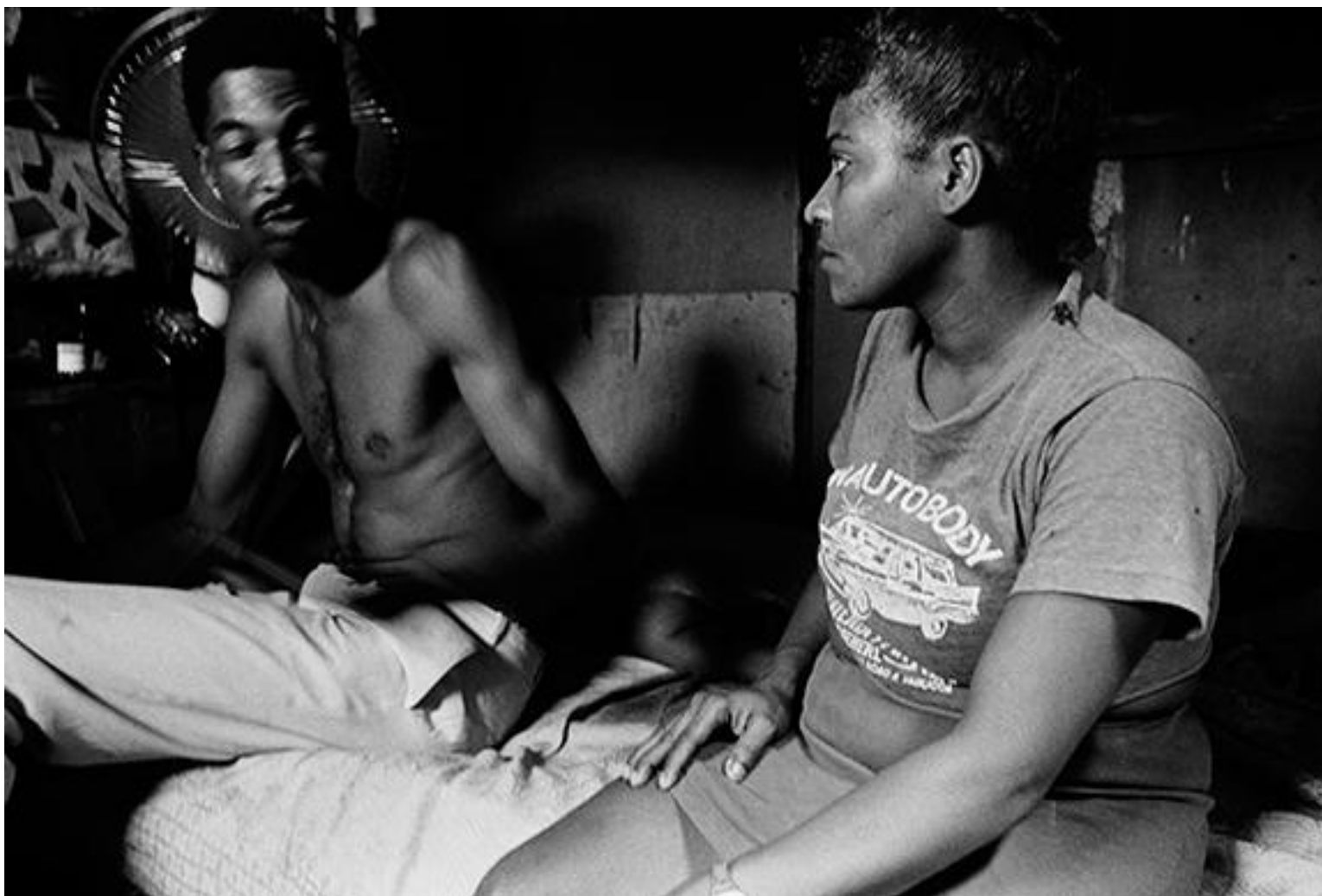
Michaele Cozzi, Esperanza y Danilo, un amor complicado . De la serie Mujeres en Común . El Gremio de las Damas, 1990. Película fotográfica, impresión digital. Tinta pigmento sobre papel de algodón 58x75 cm