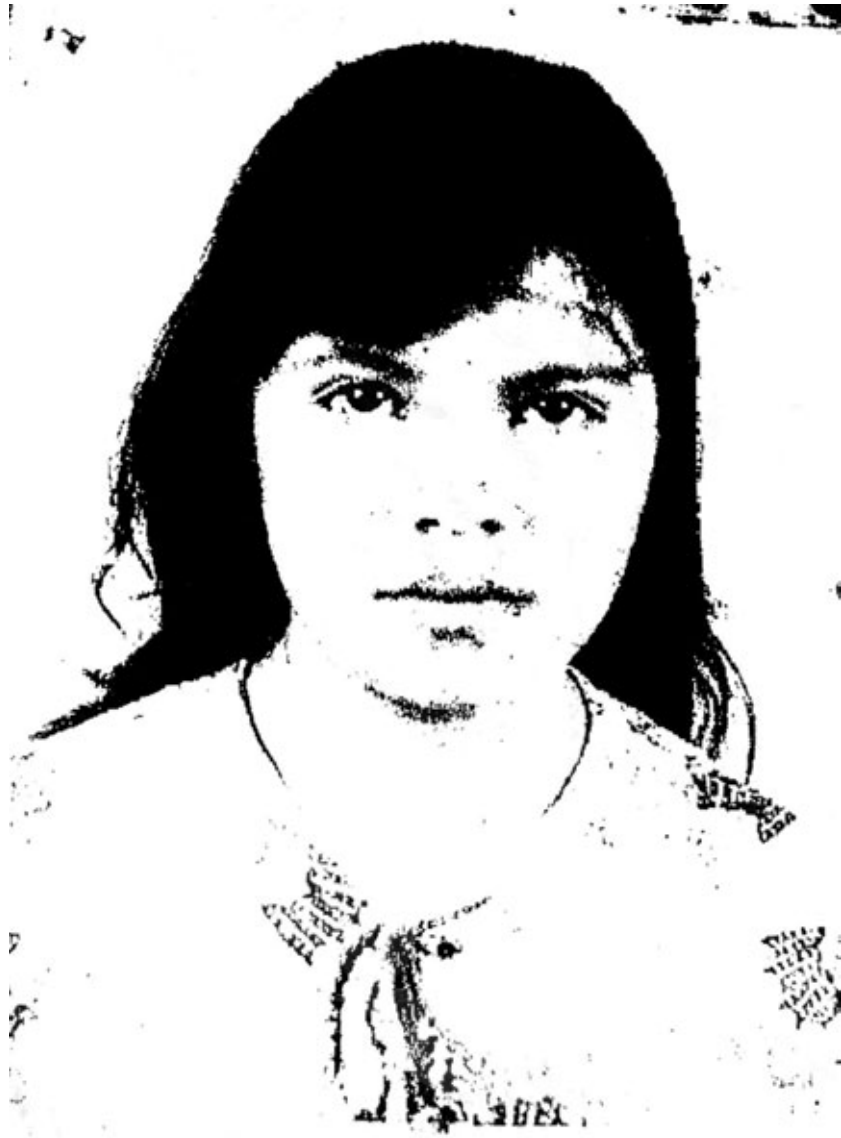
Florida , 1974, GTPN 50 S001 CUI:T 462121, S007 3375620